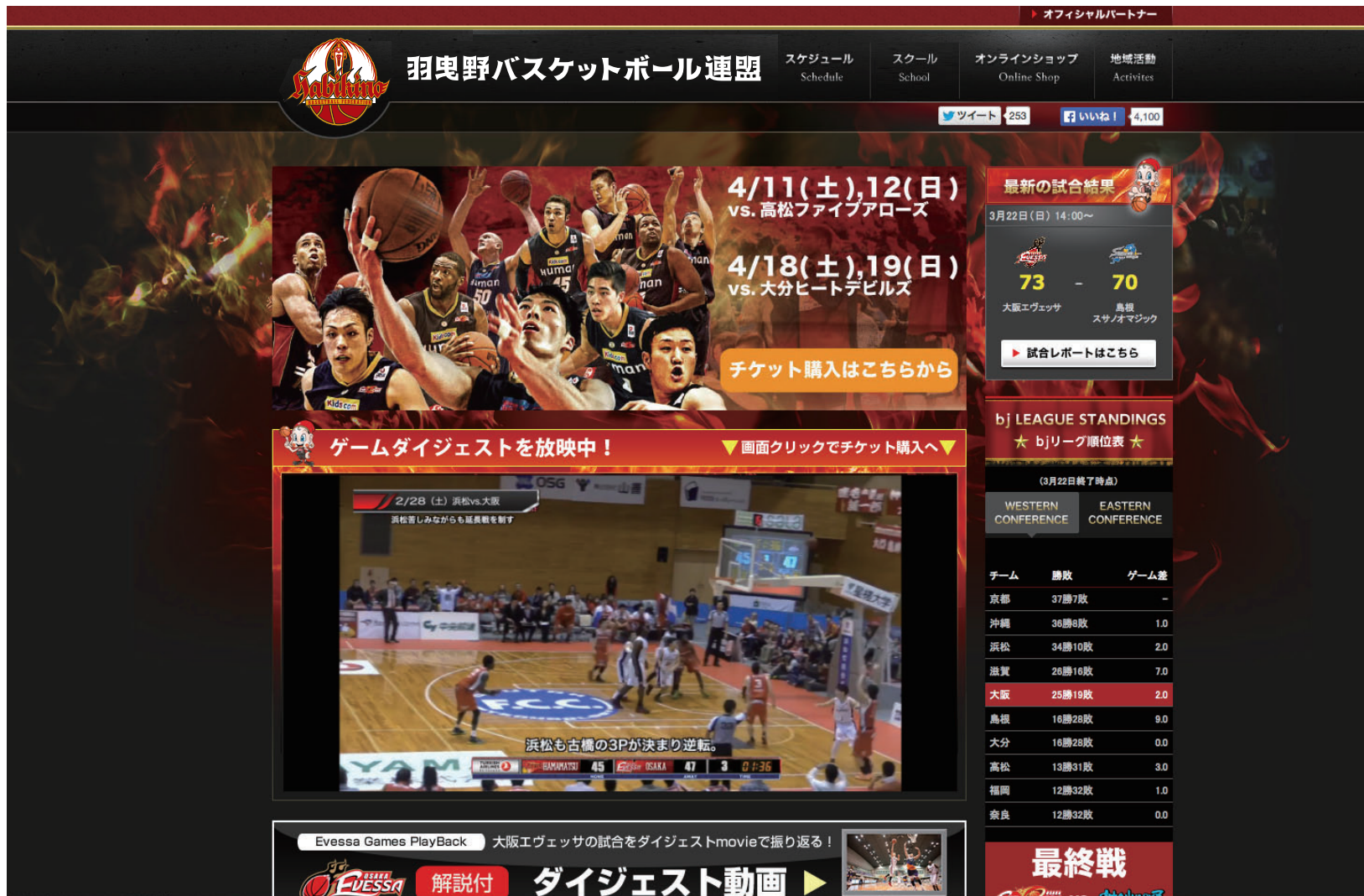
▲ WEB サイトイメージ