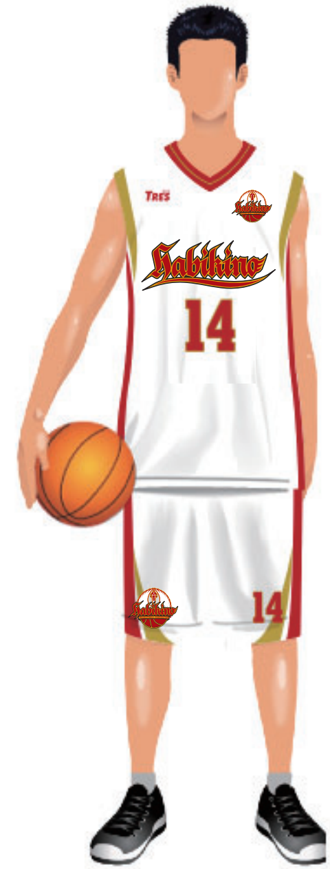
▲ マーク + 英語ロゴタイプ